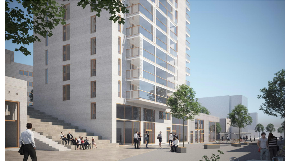
Katunäkymä Kävelykadulta. Korttelin julkisivunäkymä katua etelään. Luonnossuunnitelmien esittelyaineisto lokakuu 2020