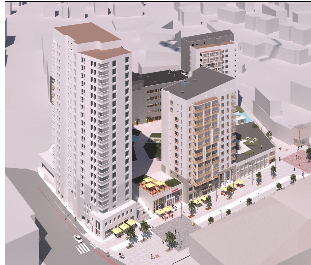
Tontti 11 As Oy Järvenpään Balanssi Julkisivut, rakennuslupa-aineisto maaliskuu 2022