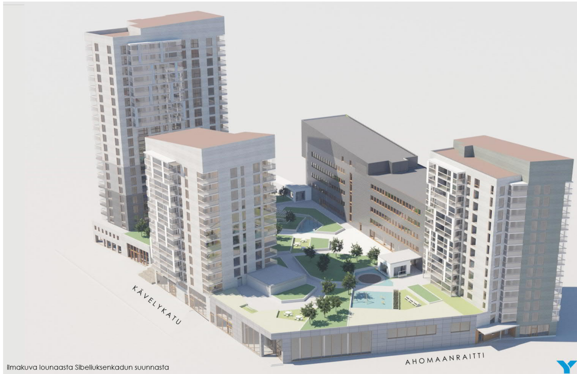
Ilmanäkymä kortteliin kaakosta Luonnossuunnitelmien esittelyaineisto lokakuu 2020