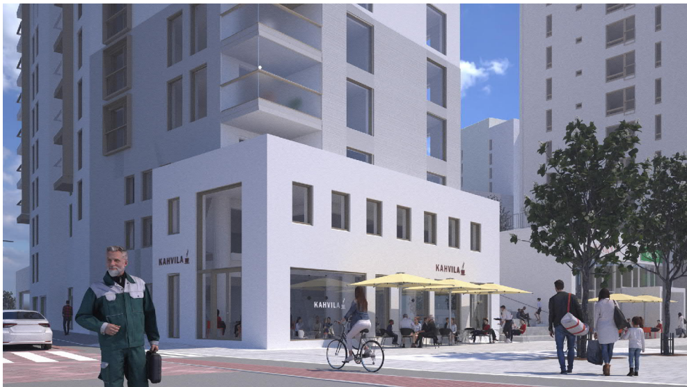
Katunäkymä Kävelykadulta. Tontin 16 "funkiskulma" Viitesuunnitelma maaliskuu 2022