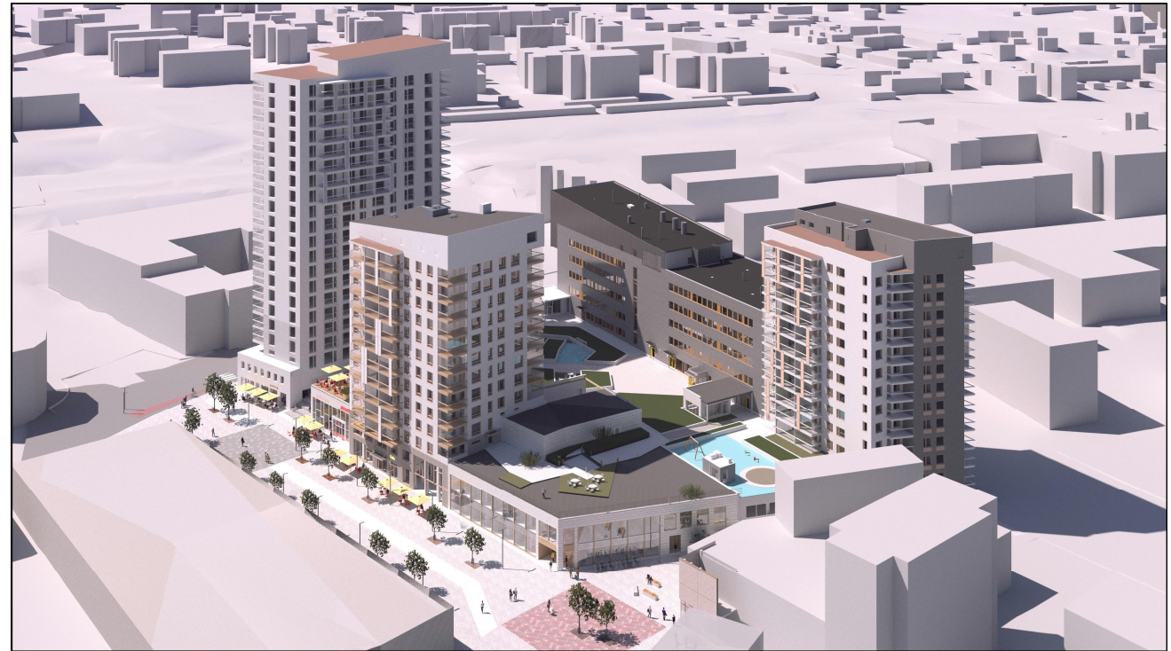
Ilmanäkymä kortteliin kaakosta Nykyinen viitesuunnitelma maaliskuu 2022