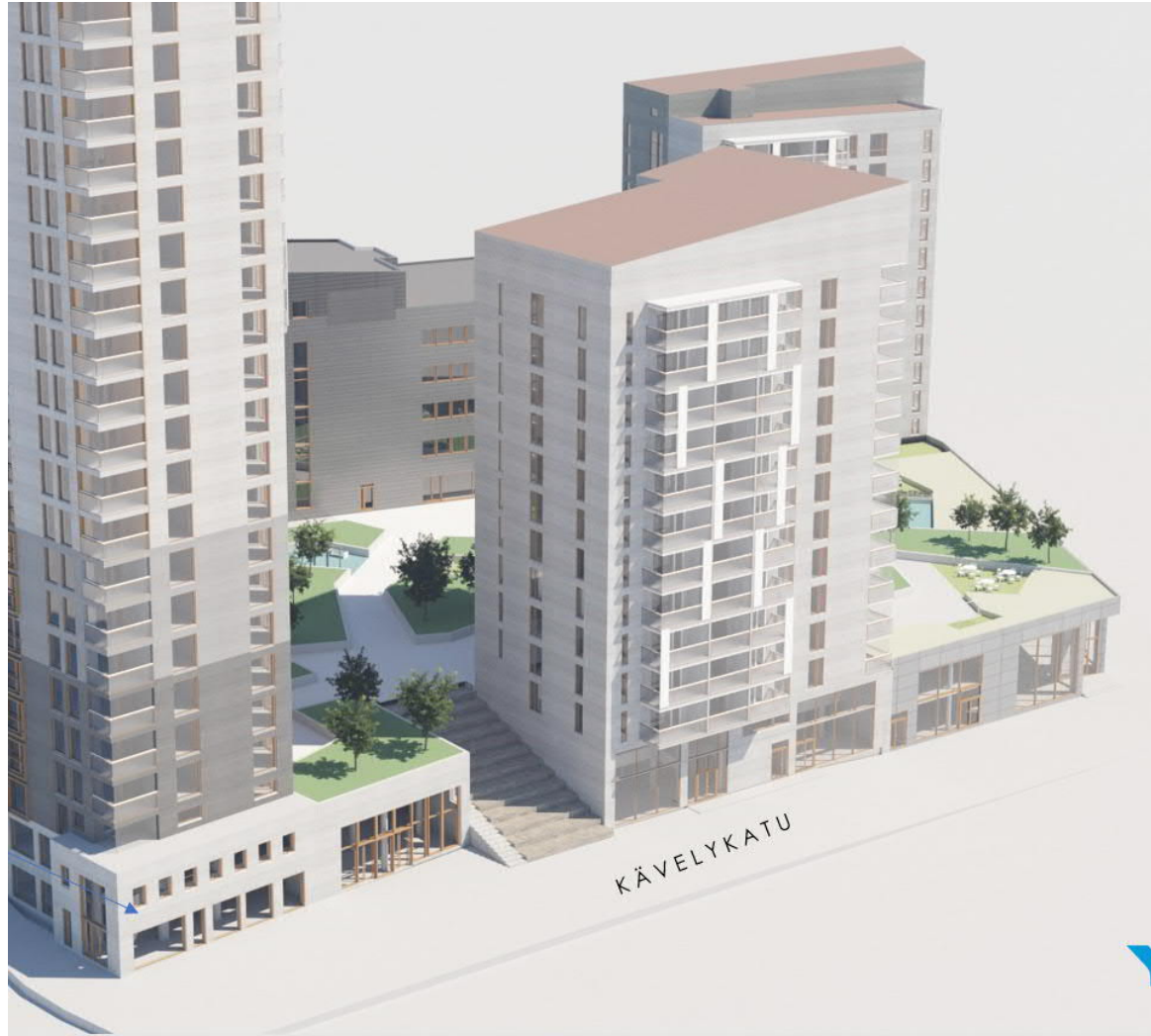
Ilmanäkymä kävelykadulle pohjoisesta Luonnossuunnitelmien esittelyaineisto lokakuu 2020

Asemakaavassa esitetty kortteliportaikon sijainti on muuttunut vuonna 2020 esitellystä viitesuunnitelmasta