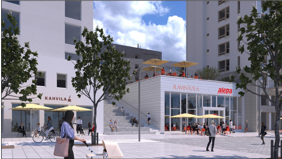
Katunäkymä Kävelykadulta. Näkymä oleskeluportaikkoon Viitesuunnitelma maaliskuu 2022

Asemakaavassa esitetty kortteliportaikon sijainti on muuttunut vuonna 2020 esitellystä viitesuunnitelmasta